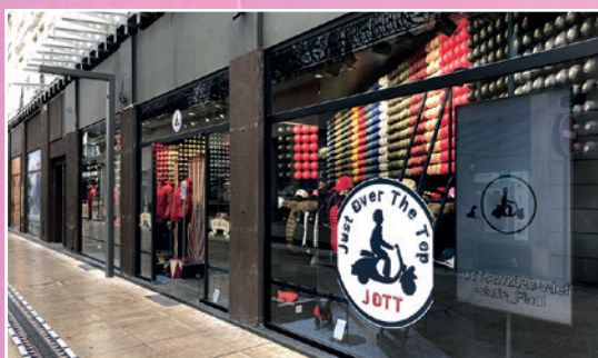
«JOTT» - 23 rue Sornin Prêt-à-porter