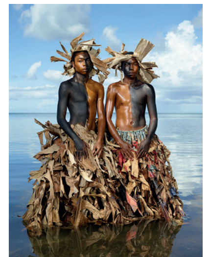
Mas a terre, Baie-Mahault, Guadeloupe, France, série Cimarron, 2014-2018