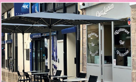
«Chez Lucien» - 11 rue Burnol Brasserie