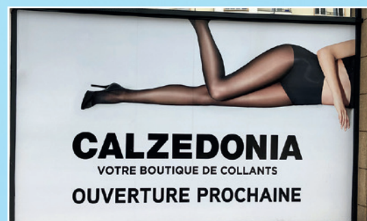
«Calzedonia» - Rue Clemenceau Marque italienne de lingerie et de maillots de bains mondialement connue avec près de 4000 boutiques