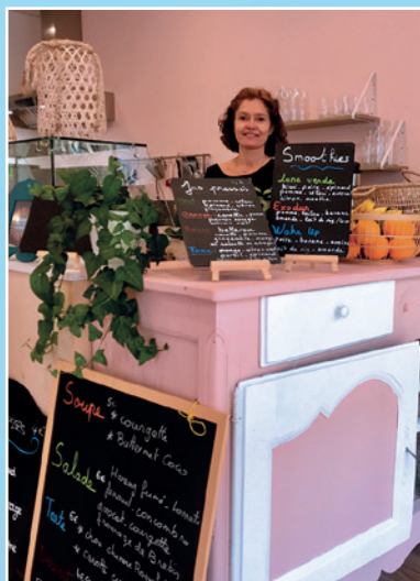
«Les Copines» 28 rue Montaret Bar à soupes et à jus, tartes et salades maison