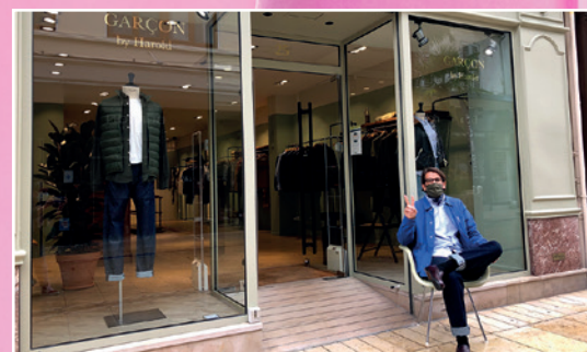
«Garçon by Harold» 25 rue de l'Hôtel des Postes Prêt-à-porter masculin