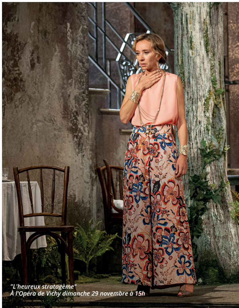
"L'heureux stratagème" À l'Opéra de Vichy dimanche 29 novembre à 15h

Oui ! Notamment le désir féminin à travers la liberté de cette comtesse, un sujet rarement évoqué à cette époque. D'ailleurs, si j'en