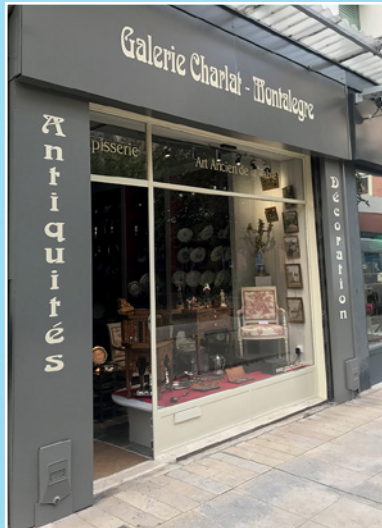
«Galerie Charlat de Montalègre» 20 rue Montaret Antiquaire