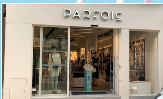
«Parfois» - Rue Clemenceau Accessoires, prêt-à-porter