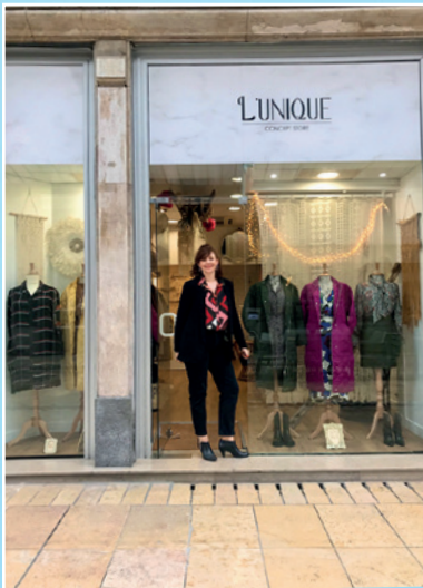
«L'Unique» 4 rue Président Roosevelt Concept store, prêt-à-porter, accessoires