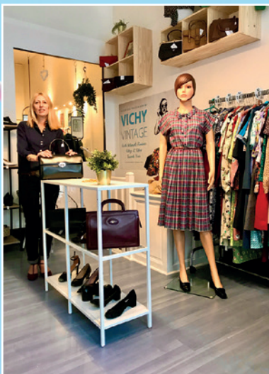
«Vichy Vintage» Place d'Allier Vêtements et accessoires rétro