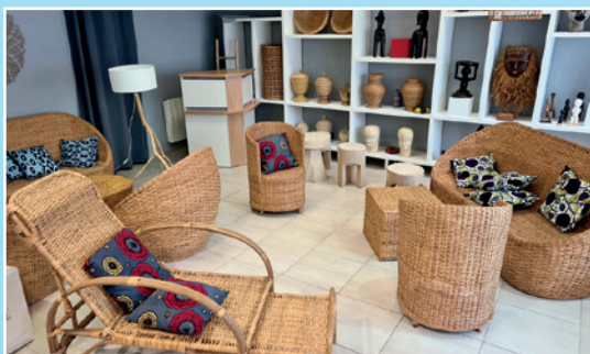
«Art 66» - 24 bis rue Lucas Galerie d'art

Une ville vivante et dynamique ne peut se concevoir sans un commerce florissant et attractif. En 2019 l'institut PROCOS ( Fédération pour la promotion du commerce spécialisé ) a distingué la Ville de Vichy au titre de la meilleure évolution dans son palmarès des centres villes les plus dynamiques. «Il faut dire que Vichy ne manque pas d'atouts, ville historique au patrimoine exceptionnel qui attire de nombreux touristes chaque année. Son statut de ville thermale autorise les commerces à ouvrir le dimanche, un vrai avantage par rapport au grand voisin Clermont» . En cette rentrée, de nouveaux commerces arrivent. Tour d'horizon.