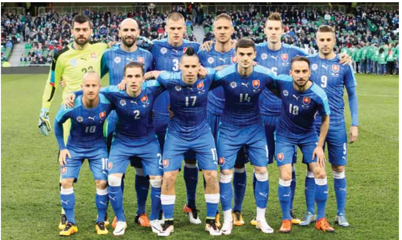
LA SLOVAQUIE EN CAMP DE BASE À VICHY ; DANS LA RÉGION AUVERGNE RHÔNE ALPES, ANNECY, EVIAN ET SAINT-JEAN D'ARDIÈRES SERONT ÉGALEMENT CAMPS DE BASE DES ÉQUIPES D'ISLANDE, D'ALLEMAGNE ET D'IRLANDE DU NORD. LYON ET SAINT-ÉTIENNE ACCUEILLERONT DES MATCHS.

Ils planteront leurs crampons au Parc Omnisports, au Stade Darragon, sur une pelouse refaite à neuf, et seront hébergés au Vichy Célestins Spa Hôtel. Un séjour très encadré, tant pour des questions de performances ( régime alimentaire, entraînements... ) que de sécurité ( plan Vigipirate ), ce qui n'empêchera pas le grand public de vivre pleinement l'évènement. Des entraînements publics gratuits sont