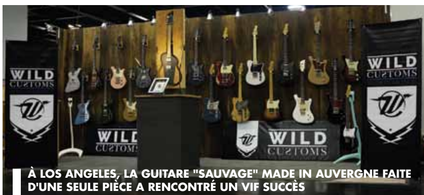
À LOS ANGELES, LA GUITARE "SAUVAGE" MADE IN AUVERGNE FAITE D'UNE SEULE PIÈCE A RENCONTRÉ UN VIF SUCCÈS

Terre d'instruments, le bassin vichyssois est un écrin pour Wild Customs et ProORCA, deux entreprises dont l'ascension dans l'industrie musicale se confirme au fil du temps.