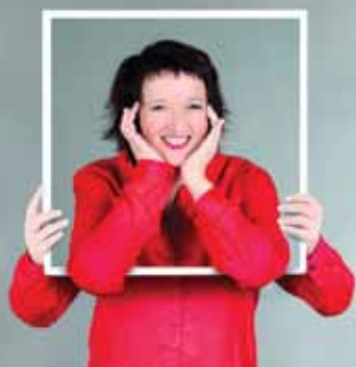
ANNE ROUMANOFF À L'OPÉRA LE 10 MAI À 20H30