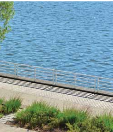
LAC D'ALLIER SE REFAIT UNE BEAUTÉ NFIE PAR VVA À L'ASSOCIATION GALATÉE

L'ambroisie présente une tige de 70 cm, verte rougeâtre et poilue, et une feuille triangulaire verte, large et très découpée.