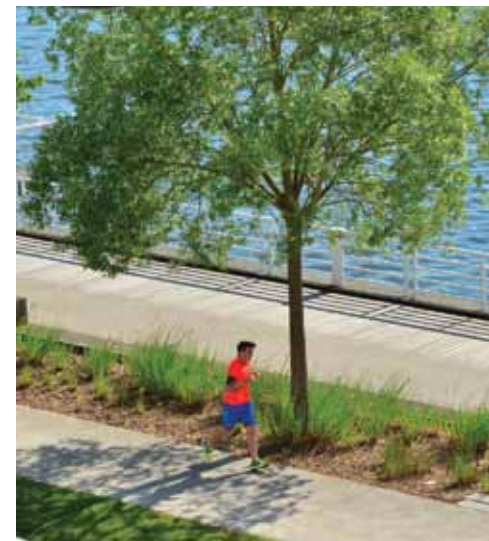
LE GARDE-CORPS DE L'ESPLANADE DU GRÂCE AU CHANTIER D'INSERTION CO

En 2015, la SEMIV achevait la transformation du quartier des Ailes avec la rénovation complète des bâtiments. Au pied des immeubles, le Parc des Ailes -repensé- invite à la détente les habitants et les promeneurs des bords d'Allier. Dès cet été, les enfants (de 3 à 13 ans)