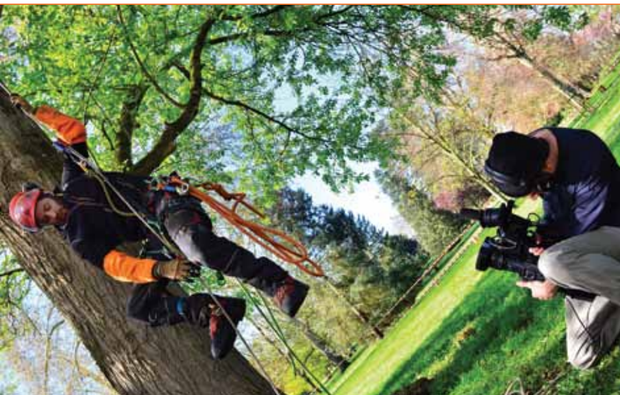
TOURNAGE DE "MÉTÉO À LA CARTE" DANS LE PARC NAPOLEON... AVANT LE CHAMPIONNAT D'ÉLAGAGE LES 24 ET 25 JUIN AU PARC DES BOURINS