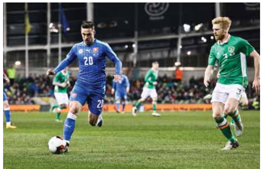
LA DÉLÉGATION SLOVAQUE SERA COMPOSÉE DE 45 PERSONNES (JOUEURS, ENTRAÎNEURS, KINÉS, STAFF TECHNIQUE, FÉDÉRATION ....)

Pour les encourager, la ville sera pavoisée aux couleurs de l'Euro et de la Slovaquie ( le blanc, le bleu et le rouge : ça ne nous changera pas trop ! ). Les professeurs de l'École de Musique ont prévu d'interpréter l'hymne slovaque à l'arrivée de l'équipe, la Médiathèque proposera une sélection d'ouvrages relatifs au Football et à la Slovaquie ( guide, histoire... ) tandis que de nombreux bars retransmettront l'évènement. En juin, Vichy vivra et vibrera au rythme de l'Euro. ■