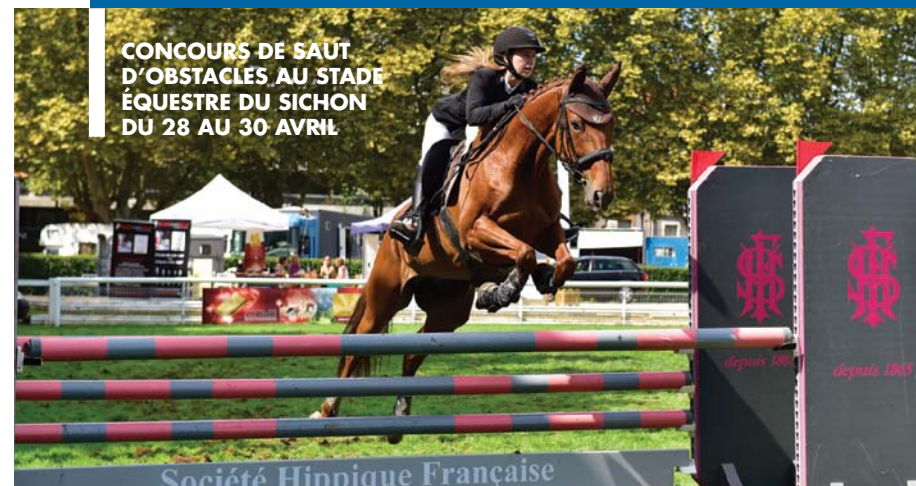
CONCOURS DE SAUT D'OBSTACLES AU STADE ÉQUESTRE DU SICHON DU 28 AU 30 AVRIL