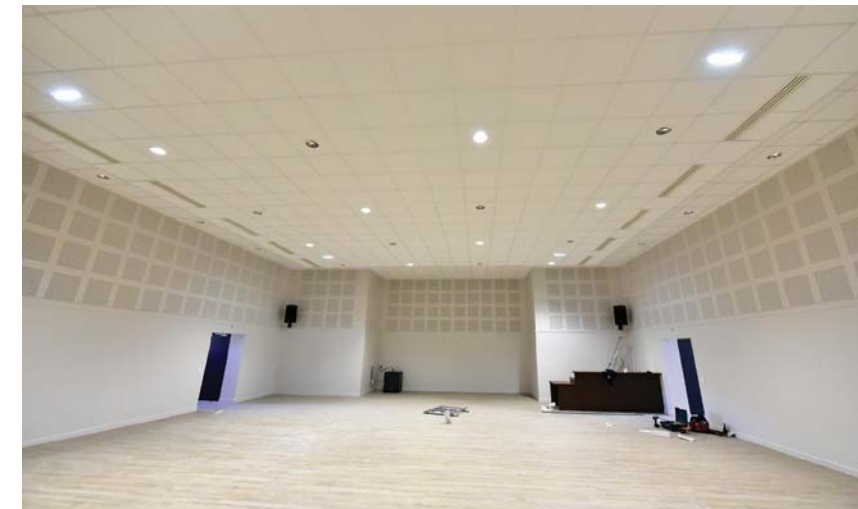
LA NOUVELLE SALLE PERMETTRA DE CRÉER UNE MAISON DE QUARTIER

Après 5 mois de travaux la salle polyvalente de la Maison de la Mutualité rouvre ses portes, encore plus largement et accueillera désormais des associations du quartier et des manifestations culturelles et de loisirs.