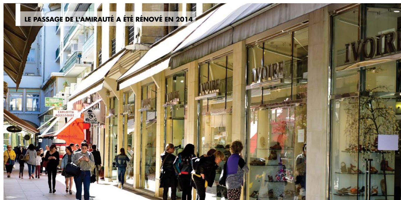
LE PASSAGE DE L'AMIRAUTÉ A ÉTÉ RÉNOVÉ EN 2014

Pourtant, malgré ces efforts soutenus, la vacance commerciale n'a pas totalement disparu du centre-ville et, à cet égard, Vichy ne diffère pas des autres villes moyennes. C'est en tous les cas le constat dressé par Procos,