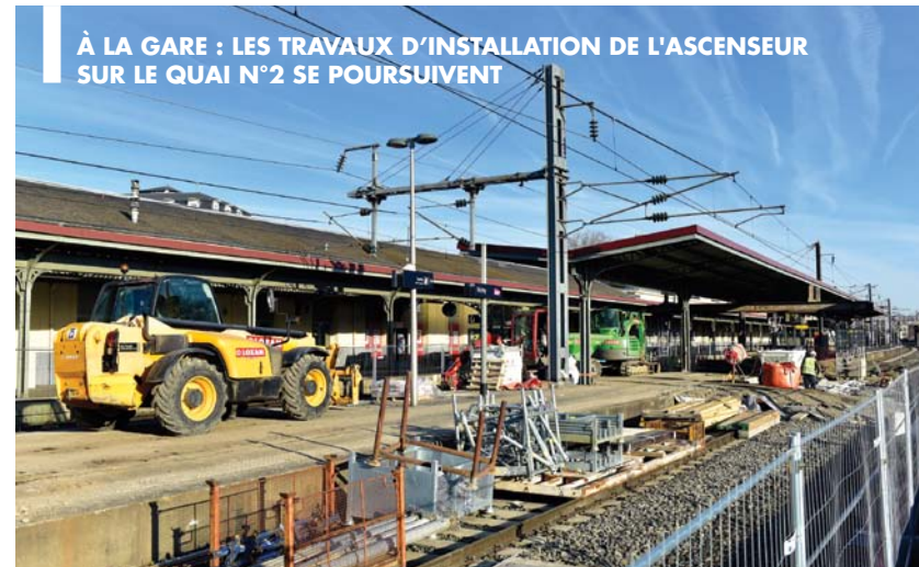
À LA GARE : LES TRAVAUX D'INSTALLATION DE L'ASCENSEUR SUR LE QUAI N°2 SE POURSUIVENT

GROUPE SCOLAIRE SÉVIGNÉ-LAFAYE Les fouilles archéologiques obligatoires sur le site sont terminées. Une fois les marchés de travaux conclus avec les entreprises et les matériels (de restauration) transférés courant avril, le chantier démarrera courant mai par les locaux de la maternelle rue des Écoles et le 1 er étage du bâtiment principal. La base chantier prendra place dans la cour côté rue des Écoles. L'école élémentaire continuera à accueillir les petits écoliers tout au long du chantier. La fin des travaux est prévue à l'été 2019. La nouvelle école qui regroupera 5 classes maternelles et 10 classes élémentaires ouvrira ses portes dans la foulée.