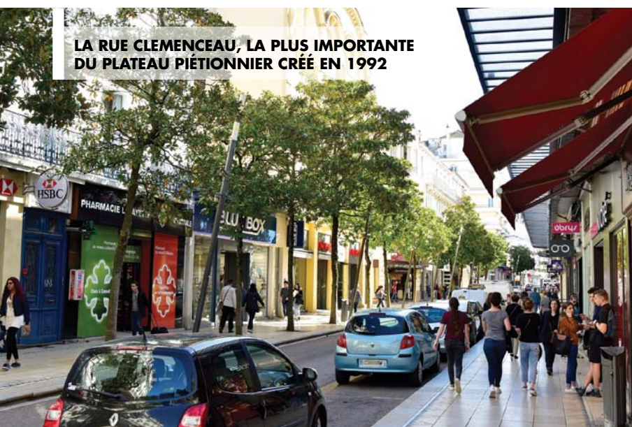
LA RUE CLEMENCEAU, LA PLUS IMPORTANTE DU PLATEAU PIÉTONNIER CRÉÉ EN 1992