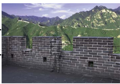
GREAT WALL, SÉRIE HIDING IN THE CITY, 2010 © LIU BOLIN - INVITÉ D'HONNEUR DE PORTRAIT(S) COURTESY GALERIE PARIS-BEIJING